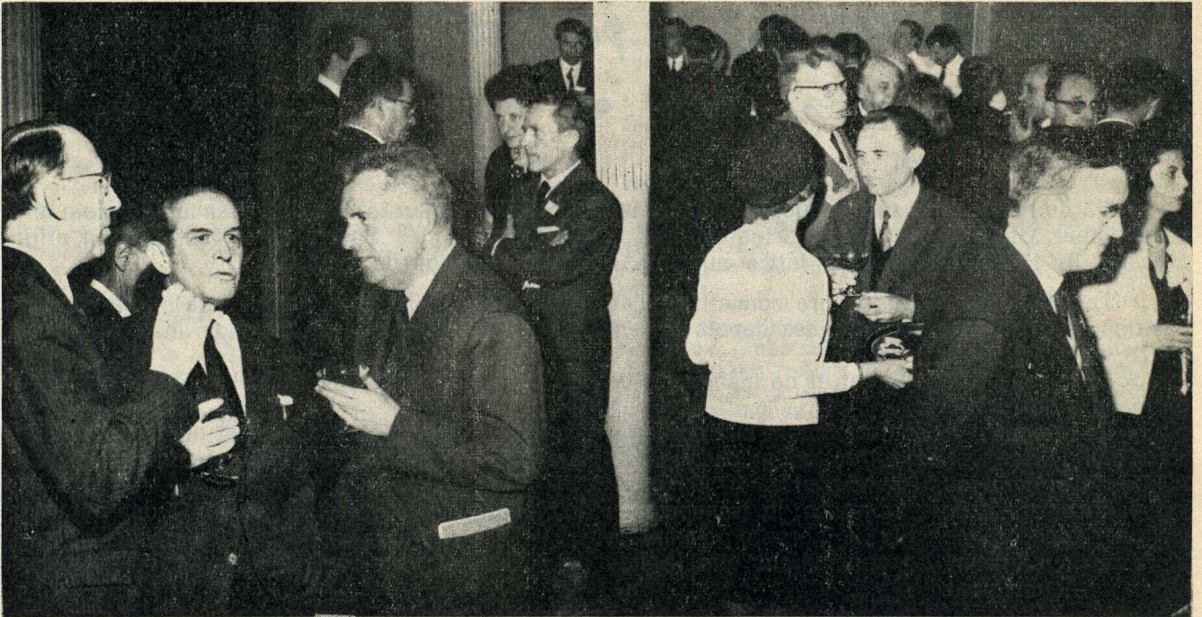
Même volonté d'aboutir dans un esprit de confiance réciproque.

Entre maîtres et parents, l'entente s'affirme devant les menaces qui pèsent sur l'Enseignement Secondaire